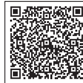
お申込みフォーム

https://www.sp-network.co.jp/event-seminar/summary/201022-spn-live.html